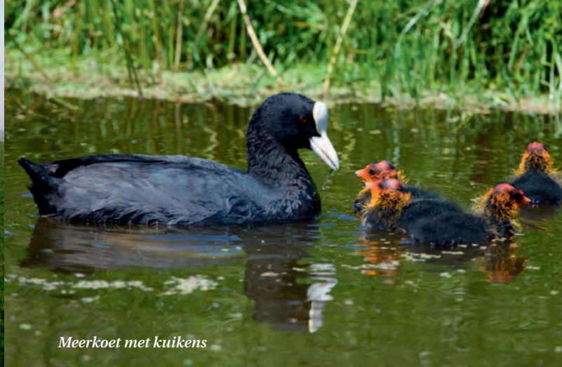
Meerkoet met kuikens

Wandelend of fietsend over de Slachte midden in het weidse landschap is het bijna onvoorstelbaar dat het water ooit tegen de dijk klotste en de oude slaperdijk het land vele malen behoedde voor overstromingen.