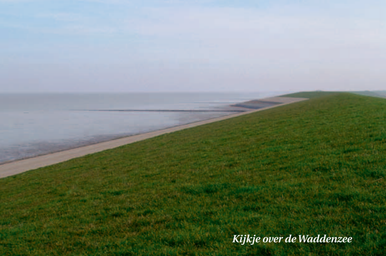
Kijkje over de Waddenzee