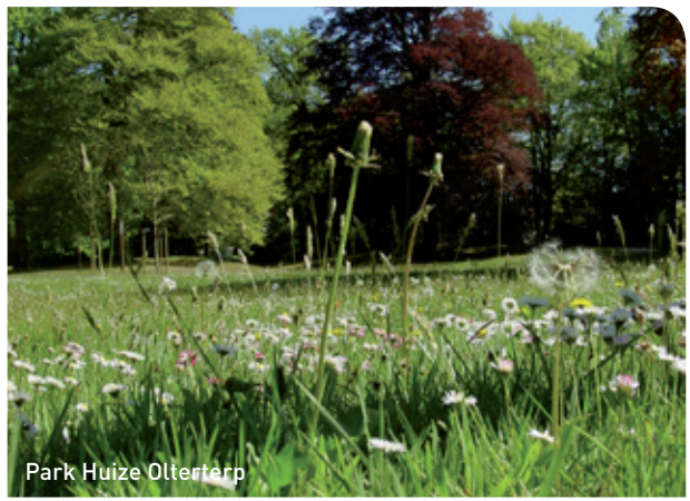
Park Huize Olterterp