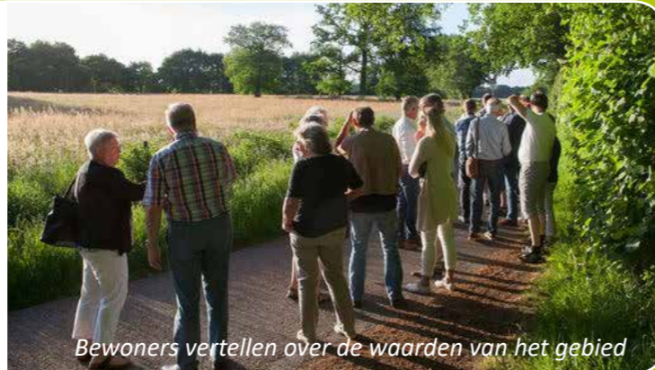
Bewoners vertellen over de waarden van het gebied

De toekomst van het landschap Rikkinge bij Oosterwolde is momenteel onduidelijk. Het gebied is nu in bezit van een agrarisch ondernemer die tot voor kort plannen had om enkele woningen te bouwen aan de rand van Rikkinge. Deze plannen stuitten op groot protest van de bewoners.