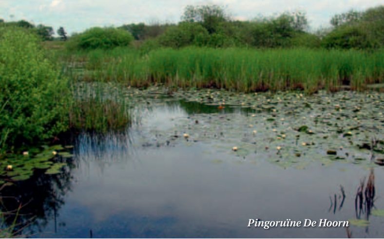
Pingoruïne De Hoorn