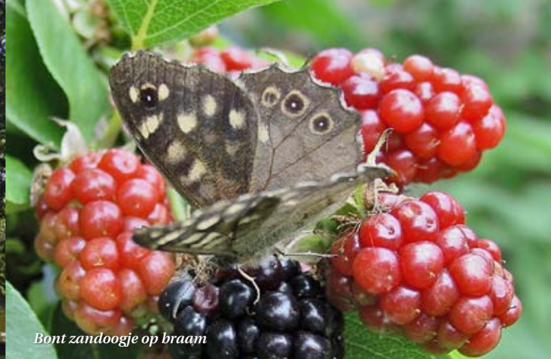
Bont zandoogje op braam