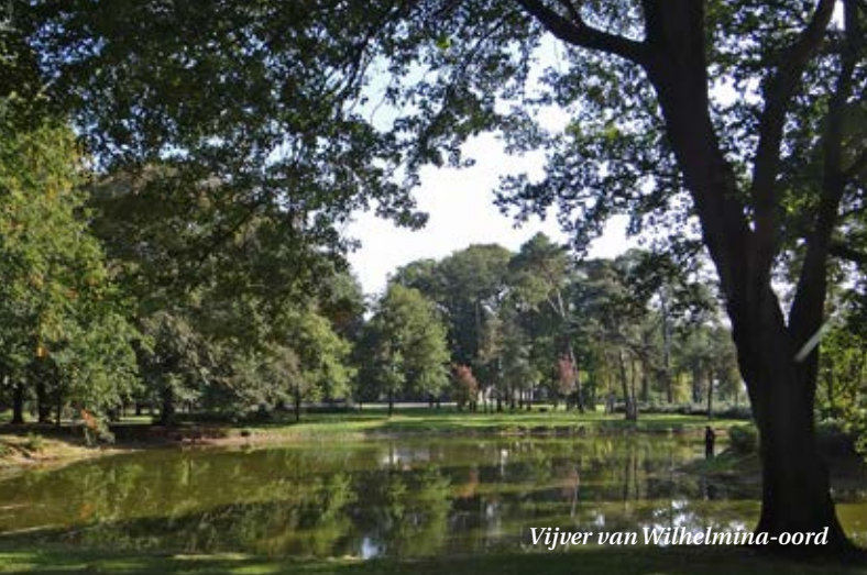
Vijver van Wilhelmina-oord