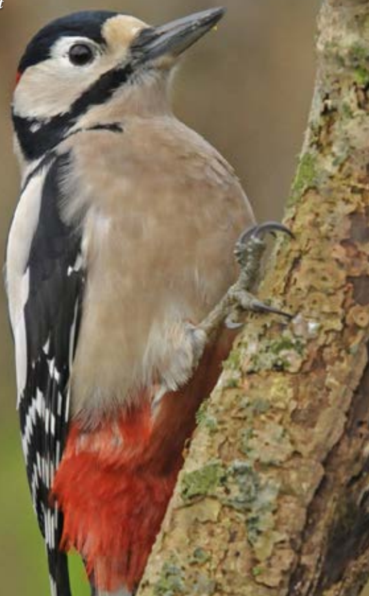
Grote bonte specht

Steeds de buitenste paden aanhouden tot voorbij de boerderij aan linkerhand en de jonge aanplant in Westerpolders.