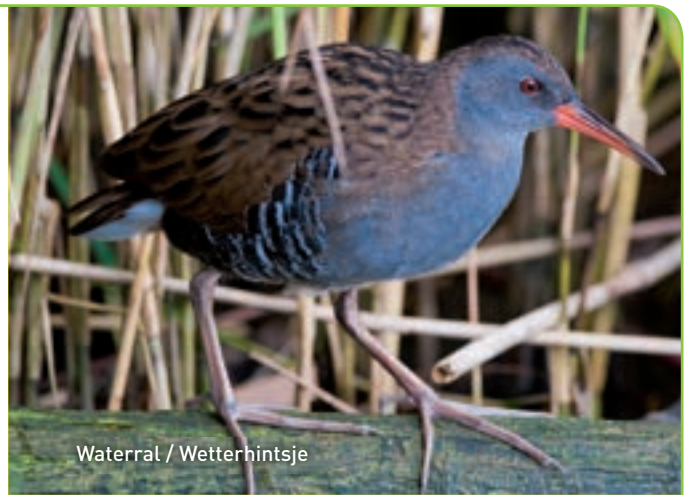
Waterral / Wetterhintsje