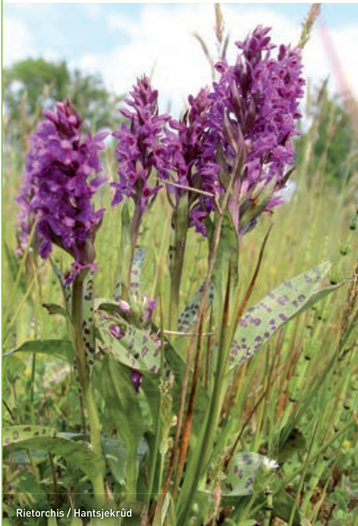
Rietorchis / Hantsjekrûd

Deze zeldzame en beschermde vegetatie komt voor in laagveengebieden. Veenmosrietlanden ontstaan door het verlanden van petgaten met riet. Jarenlang rietbeheer zorgt voor een voedselarme rietkragge die steeds dikker wordt. Door de invloed van regenwater ontstaat een zure vegetatie met veenmossen en andere bijzondere soorten als zonnedauw, varens en rietorchis.