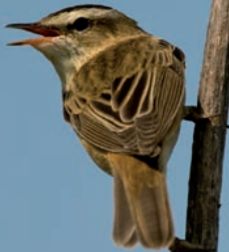
Rietzanger / Reidsjonger