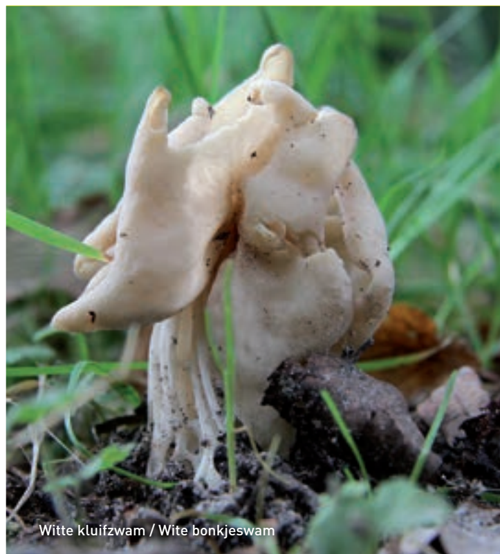
Witte kluiwzwam / Wite bonkjeszwam

beuken met lichte kringen in het mos. Wie geluk heeft, ziet de op dood lijkende plekken kleine, schelpachtige op de kop hangende paddenstoeltjes. Het mosschelpje is waarschijnlijk de meest zeldzame paddenstoel in Wilhelmina-oard.