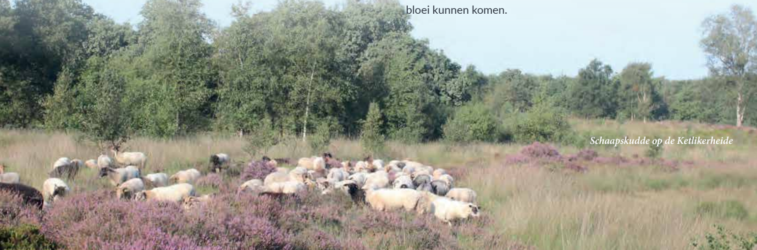
Schaapskudde op de Ketlikerheide

In de zomer wemelt het in de Tsjongerdellen van libellensoorten, waaronder bruine korenbouten en groene glazenmakers. De oude meanders van de rivier, die aan het eind van de 19e eeuw is gekanaliseerd, zijn opnieuw uitgegraven. Ooit gold de Tsjonger als de sterkst meanderende rivier van Noord-Nederland. De 'rivier' was vanwege aanhoudende overstromingen getemd door de aanleg van drie sluizen, zes bruggen en 22 duikers en zes sluiswachterswoningen. Inmiddels zijn de inzichten veranderd en krijgt waar mogelijk het water weer meer ruimte. Het grasland staat 's winters en het vroege voorjaar, vooral bij veel regenval en aanhoudende westenwind, blank zodat dotterbloem, koekoeksbloem en waterkruiskruid tot bloei kunnen komen.