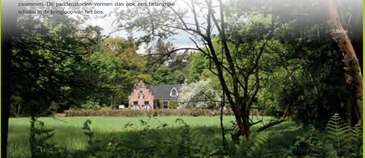
Expoorport op de Heide van Amelzath