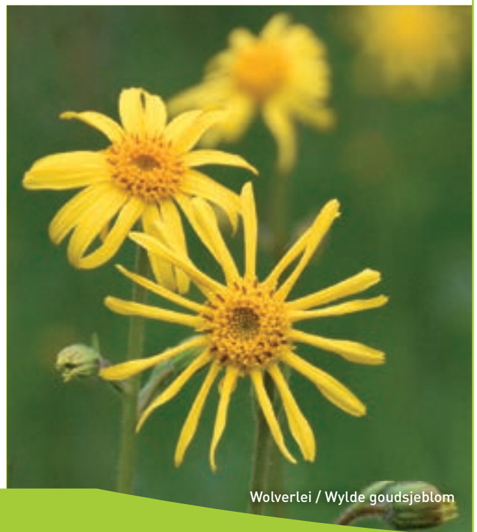
Wolverlei / Wylde goudsjeblom