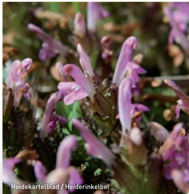
Heidekartelblad / Heiderinkelbet

Landbouwgrond omturnen zodat natuurgebieden kunnen worden uitgebreid. Het is een strategie om natuur robuuster te maken. Ook bij de Schaopedobbe heeft It Fryske Gea de afgelopen jaren landbouwgrond verworven en ontdaan van de rijke bodemlaag, de teelaarde. Het oorspronkelijke reliëf is teruggebracht zodat het heidezaad weer kan ontkiemen en het heideareaal de laatste jaren fors is toegenomen. Onder andere muizenoor, klein vogelpootje en klein tasjeskruid komen hier voor. Het duurt echter nog wel 'even' voor de heide er weer volop bloeit.