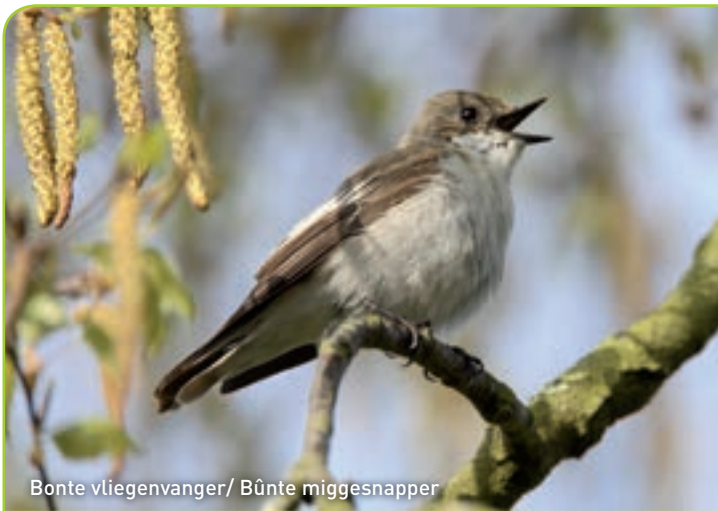
Bonte vliegenvanger / Bunte miggesnapper