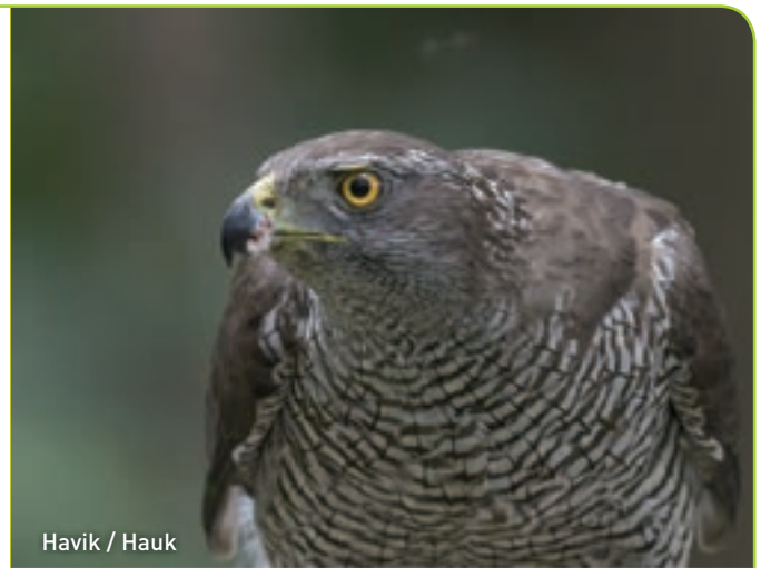
Havik / Hawk