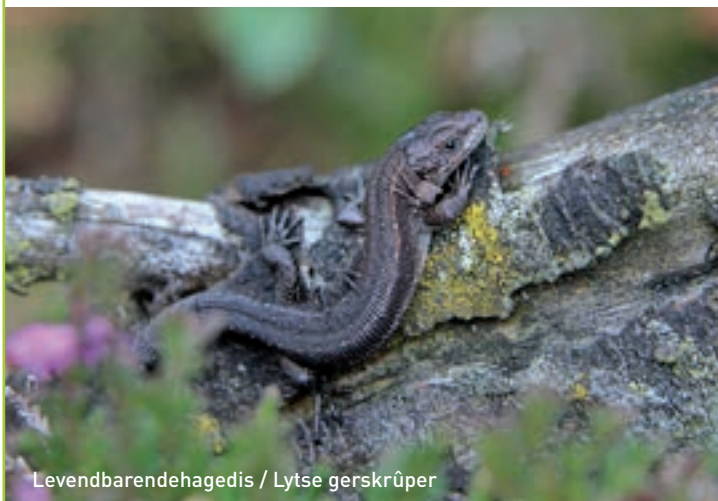
Levendbarende hagedis / Lytse gerskrûper

Heidevelden zijn prachtig als de heide in bloei staat, maar ook in andere jaargetijden bieden ze een boeiend kleurenpalet. Vooral in het voorjaar zorgen het warmgroen van de kraaiheide, het grijs van de gewone dopheide en de lichtgele stengels van het pijpenstrootje voor prachtige kleureffecten. Dan vallen ook de rendier- en bekersmossen zoals het rode heidestaartje op.