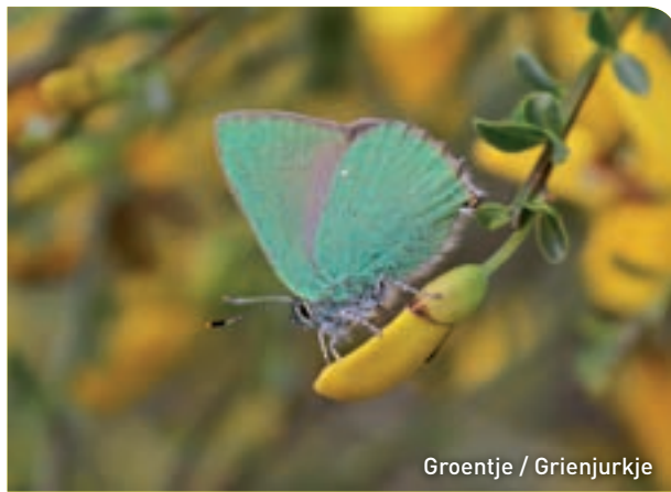
Groentje / Grienjurkje

Tientallen soorten vlinders kiezen de Schaopedobbe als hun leefgebied. Alleen al twintig soorten dagvlinders fladderen er rond, zoals het groentje, de kommavlinder en het heideblauwtje. Helaas dartelt het zeldzame gentiaanblauwtje door verschillende oorzaken hier niet meer. Libellen zijn wel rijkelijk aanwezig.