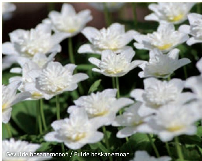
Gevulde bosanemoon / Fulde boskanemoon

De botanische rijkdom van dit wandelbos is van grote waarde. In het voorjaar bloeit de stinzenflora weelderig. Deze stamt waar-