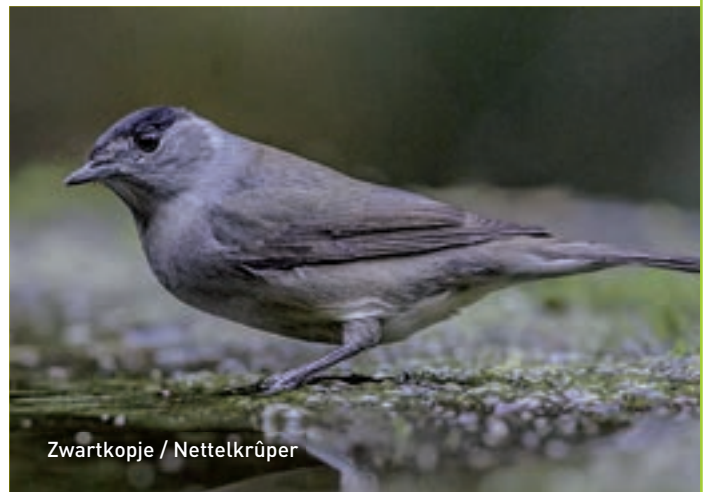
Zwartkopje / Nettelkrûper

In het kader van de ruilverkaveling is een 'groene' verbinding-zone gemaakt met de Vegelinsbossen aan de noordkant van het dorp. In wat 'De Heide' wordt genoemd - hier was vroeger één groot heidegebied - is onlangs een wandelpad gemaakt. Het pad is omzoomd door een singel tot aan het bos en rond een stuk dat is aangeplant met bomen en struiken. De bosrand van deze aanplant is flink opengemaakt zodat er veel meer ruimte is voor vogels en insecten. In enkele sloten groeit volop krabbenscheer en voor li-