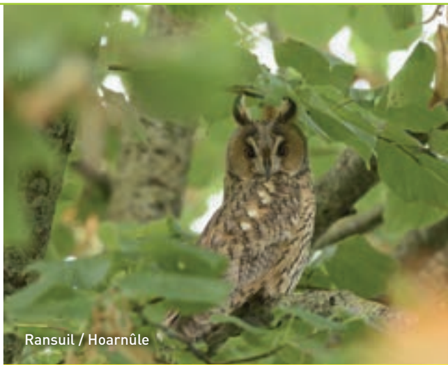
Ransuil / Hoarnûle

Waddeneilanden en is in het verleden tweemaal gezien in het Wikelerbos, op de plek waar ook de stinzenplanten groeien. Het Sparrenveertje is een koraalachtige zwam met een teerachtige geur. Deze inheemse paddenstoel is okerbruin tot lilabruin.