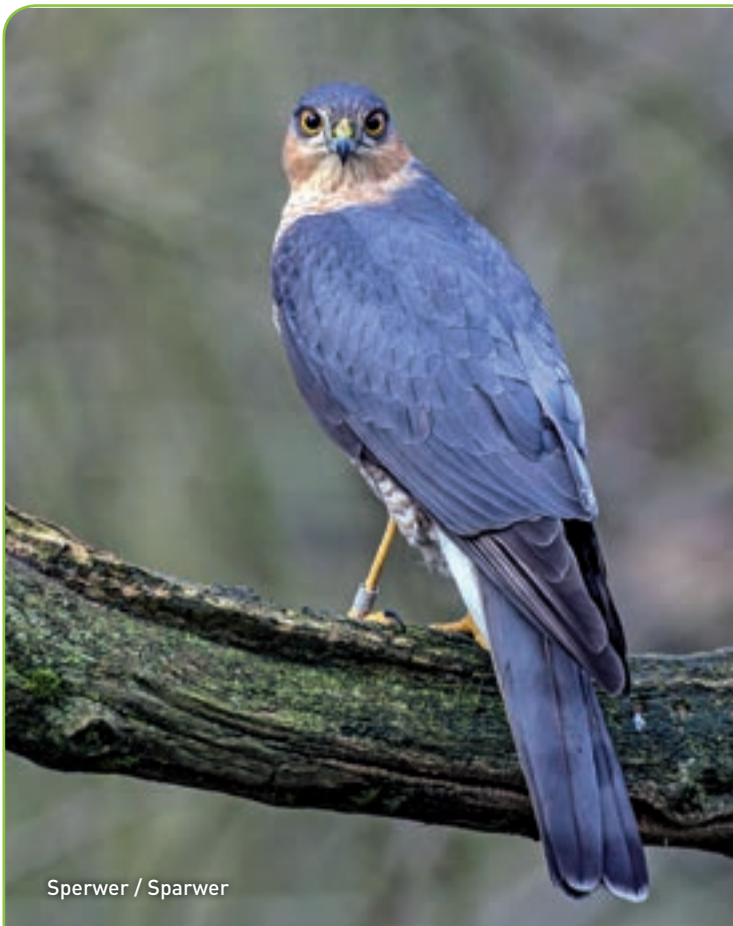
Sperwer / Sparwer