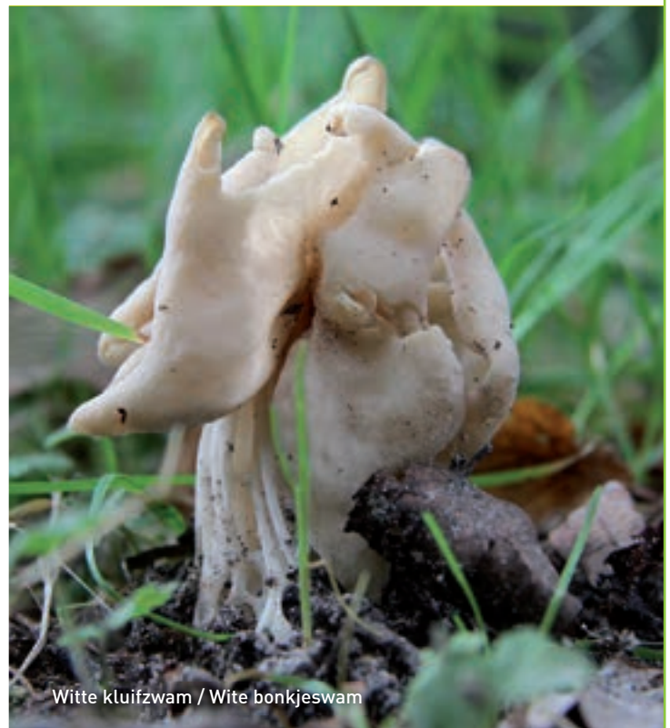
Witte kluiwzwam / Wite bonkjeszwam

beuken met lichte kringen in het mos. Wie geluk heeft, ziet de op dood lijkende plekken kleine, schelpachtige op de kop hangende paddenstoeltjes. Het mosschelpje is waarschijnlijk de meest zeldzame paddenstoel in Wilhelmina-oard.