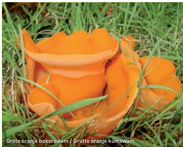
Grote oranje bekerzwam / Grutte oranje kûmswam

Het Wikelerbosk kent maar liefst 120 soorten paddenstoelen. Algemene soorten zijn gewone zwavelkop, gele aardappelbovist, geelwitte russela, gewoon elfenbankje en melksteelmycena. Opvallender en zeldzamer zijn grote oranje bekerzwam, zwavelzwam, witte kluiwzwam en de in onze provincie heel spaarzame sparrenveertje en gewone morielje. Deze gewone morielje is overigens een typische voorjaarssoort in vooral april en mei. De zeldzame paddenstoel staat op de Rode Lijst en komt vooral voor op de