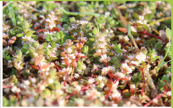
Grondster / Grûnstjerke