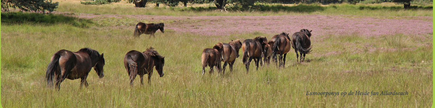
Exmoorponys op de Heide fan Allardseach