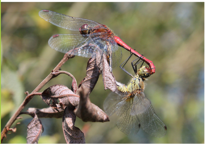
Bloedrode heidelibel / Bloedhopke

Het Mandefjild en omgeving tellen nogal wat dobben en pingo's. De Harmsdobbe – naar boer Harm Terpstra die de dobbe begin vorige eeuw liet uitbaggeren – diende jarenlang als zwemgelegenheid. In het voedselarme water doen soorten als waterdrieblad, wateraardbei en veenpluis het goed. Bijzonder is de zeldzame slangenwortel. Ook is het een kraamkamer voor libellen, zoals de steenrode en bloedrode heidelibel.