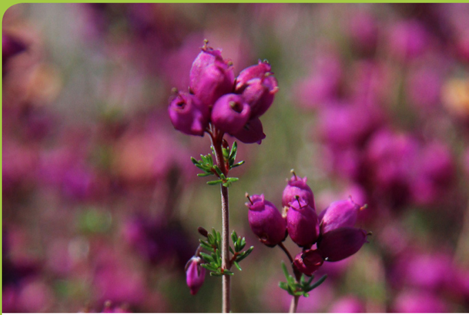
Rode dophei / Reade skrobberheide