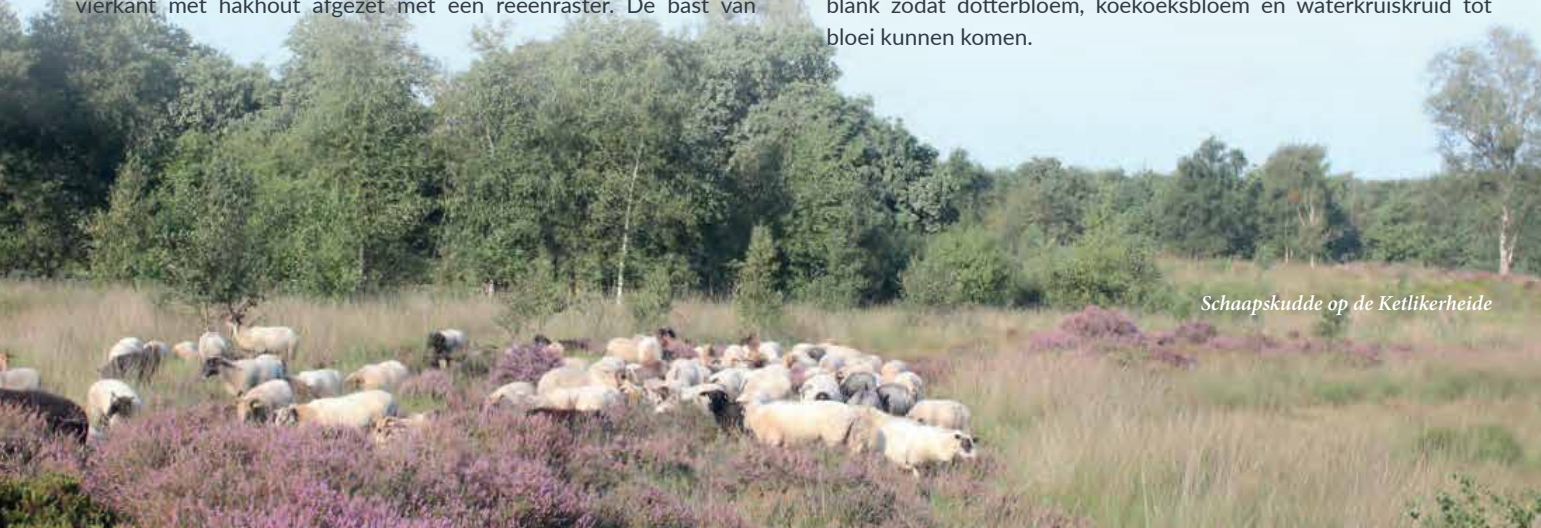
Schaapskudde op de Ketlikerheide

In de zomer wemelt het in de Tsjongerdellen van libellensoorten, waaronder bruine korenbouten en groene glazenmakers. De oude meanders van de rivier, die aan het eind van de 19e eeuw is gekanaliseerd, zijn opnieuw uitgegraven. Ooit gold de Tsjonger als de sterkst meanderende rivier van Noord-Nederland. De 'rivier' was vanwege aanhoudende overstromingen getemd door de aanleg van drie sluizen, zes bruggen en 22 duikers en zes sluiswachterswoningen. Inmiddels zijn de inzichten veranderd en krijgt waar mogelijk het water weer meer ruimte. Het grasland staat 's winters en het vroege voorjaar, vooral bij veel regenval en aanhoudende westenwind, blank zodat dotterbloem, koekoeksbloem en waterkruiskruid tot bloei kunnen komen.