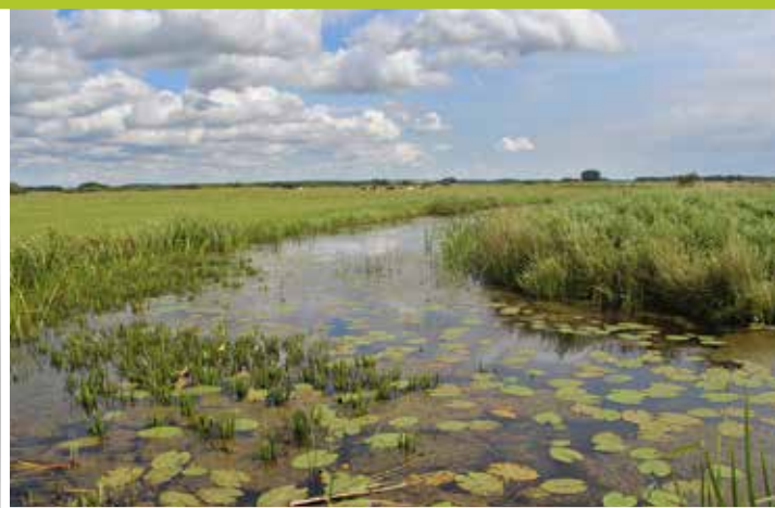
Oude meander in de Tsjongerdellen

In het bos, met afwisselend naald- en loofbomen, is een groot vierkant met hakhout afgezet met een reeënraaster. De bast van