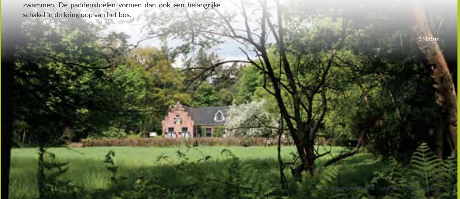
Exemplaar van de Heide van Amrum