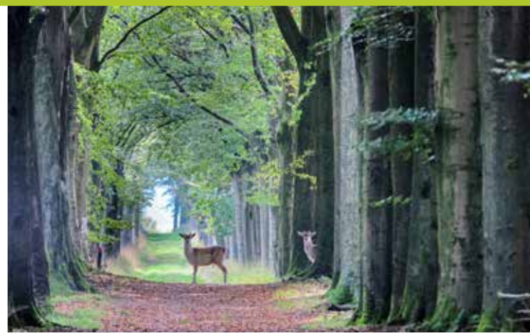
Damhert / Daim